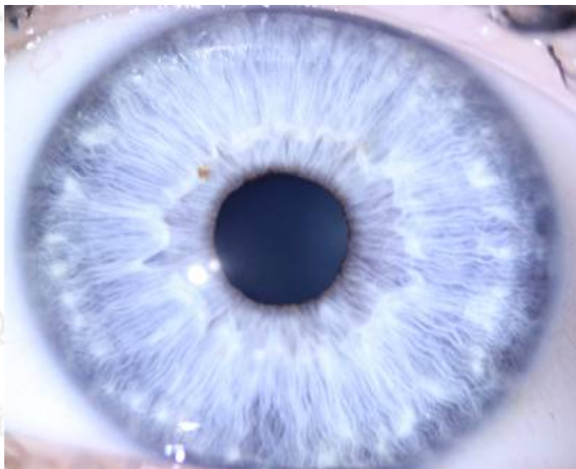
-constitution lymphatique fibrillaire (œil bleu) pourra varier vers vert, gris-